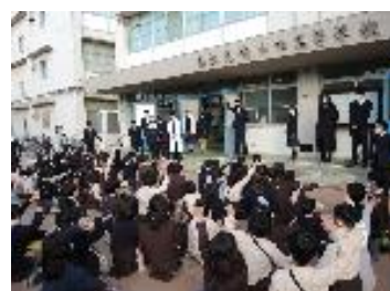
図1 高校生による算数・理科の授業

12/1（木）本校にて、尼崎市立清和小学校より児童（3、4年生）と先生方を招き、算数理科教室を実施しました。高校生はこの日のために、小学生向けの実験を準備しました。ここでも他者に自分の考えを伝えることの難しさを実感したようです。小学生の皆さんは興味を持って実験しており、そのことが高校生にとって嬉しいことだったようです。